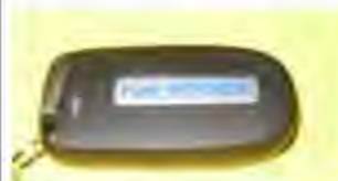
Installed view of Mopar Logo Vue du logo Mopar installes Ver instalada de Mopar Logo